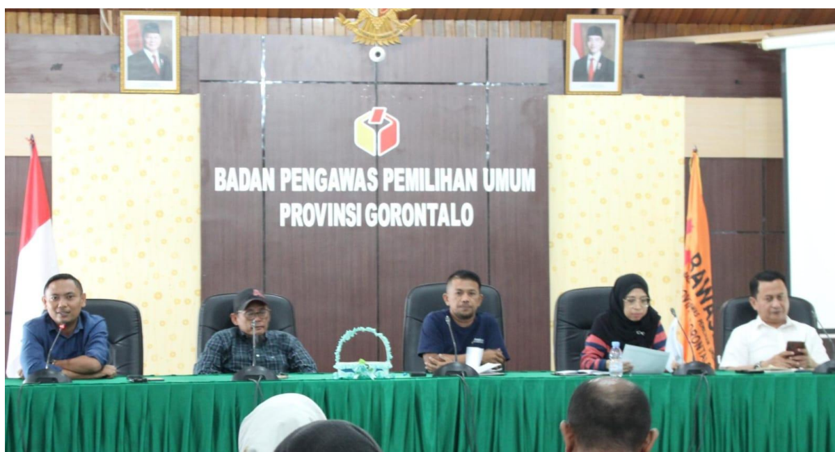
Rapat Final Check Up Kesiapan Kegiatan Kelembagaan di Aula Amin Abdullah, Minggu (24/08/2025)

Gorontalo, Badan Pengawas Pemilihan Umum Provinsi Gorontalo - Bawaslu Provinsi Gorontalo menggelar rapat final check up kesiapan kegiatan kelembagaan yang akan dilaksanakan pekan depan. Rapat berlangsung di Aula Amin Abdullah, Minggu (24/08/2025), dengan menghadirkan seluruh pimpinan Bawaslu Provinsi serta jajaran sekretariat.