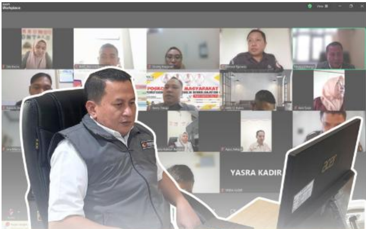
Rapat Evaluasi Pengelolaan Keuangan Bawaslu se-Provinsi Gorontalo, melalui Zoom Meeting Selasa (15/07/2025)

Gorontalo, Badan Pengawas Pemilihan Umum Provinsi Gorontalo - Bawaslu Provinsi Gorontalo menggelar Rapat Evaluasi Pengelolaan Keuangan yang melibatkan jajaran Bawaslu Kabupaten/Kota se-Provinsi Gorontalo, Selasa (15/07/2025). Kegiatan ini dilaksanakan secara daring melalui Zoom Meeting dan menjadi bagian dari upaya peningkatan tata kelola keuangan yang akuntabel dan transparan di lingkungan Bawaslu.