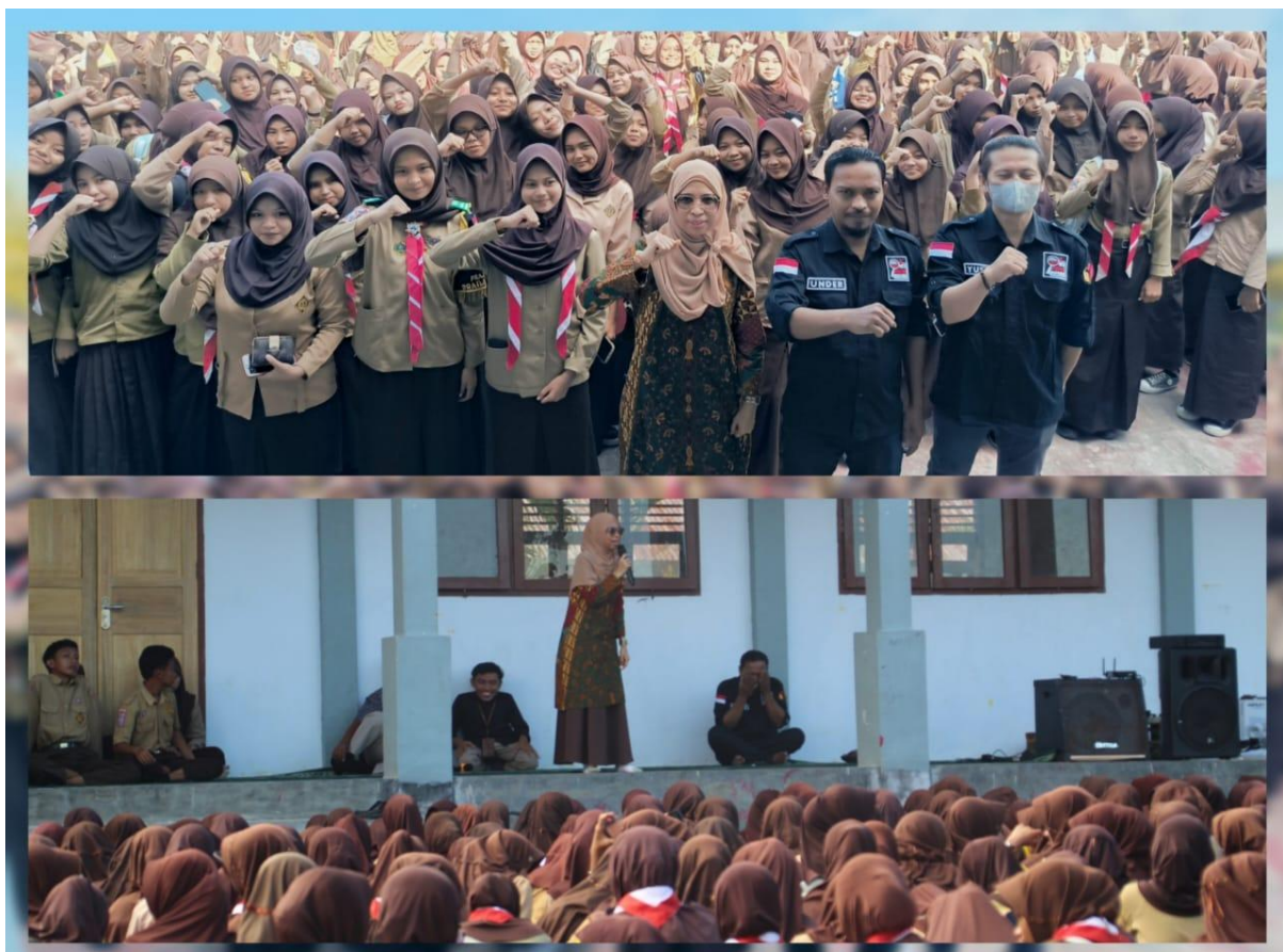
Lismawy Ibrahim Dalam Bawaslu Goes To School, yang diselenggarakan oleh Bawaslu Kabupaten Gorontalo di SMA Negeri 1 Tibawa, Kabupaten Gorontalo, Jumat (1/8/2025)

Gorontalo, Badan Pengawas Pemilihan Umum Provinsi Gorontalo - Bawaslu Provinsi Gorontalo menggelar Rapat Evaluasi Pengelolaan Keuangan yang melibatkan jajaran Bawaslu Kabupaten/Kota se-Provinsi Gorontalo, Selasa (15/07/2025). Kegiatan ini dilaksanakan secara daring melalui Zoom Meeting dan menjadi bagian dari upaya peningkatan tata kelola keuangan yang akuntabel dan transparan di lingkungan Bawaslu.